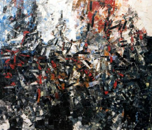
Resim 10. Jean-Paul Riopelle, Orman Yakma, 1955, 76,5 X 90, 5 inch.