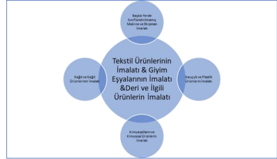
Şekil 3: Tekstil Sektörünün İmalatı, Giyim Eşyalarının İmalatı ve Deri ve İlgili Ürünlerin İmalatı Sektörlerinin Yoğun Alış-Veriş Yaptığı Sektörler