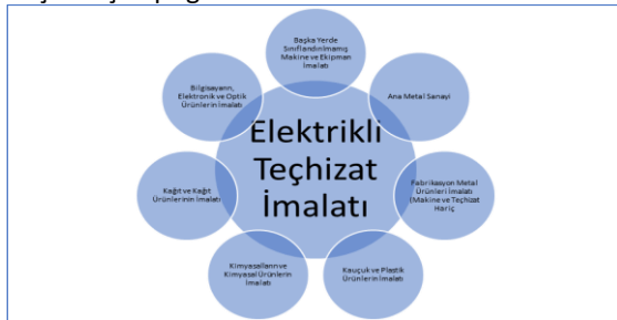
Şekil 2: Elektrikli Teçhizat İmalatı Sektörünün Yoğun Alış-Veriş Yaptığı Sektörler