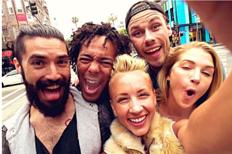
Görsel 6. Selfie Örneği