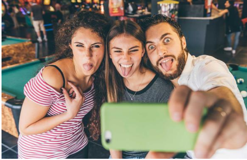
Görsel 7. Selfie Örneği