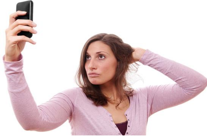
Görsel 5. Selfie Örneği