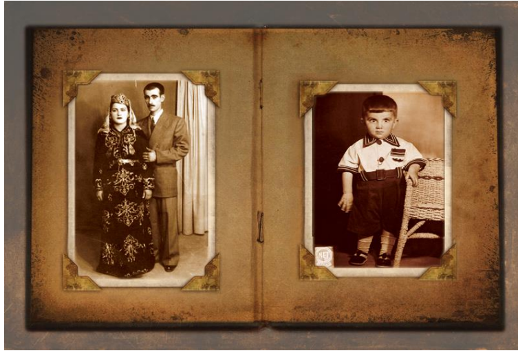
Görsel 1. Aile Fotoğraf Albümü

kadraja dizilmiş, gözlerinde mutluluk, heyecan, gururla fotoğraftan dışarı fırlayacak gibi görünmektedirler. Her birinin anlattığı bir mesaj ve hikaye bulunmakta ve bu yaşananları kendisini inceleyen/bakan izleyenle paylaşmakta oldukları algılanmaktadır. Ölümden sonra da yaşandığının belgesidir bu fotoğraf kareleri. Dünyanın neresinde olursanız olun hangi dili konuşursanız konuşun herkese aynı duyguyu ve mesajı verdikleri ortak bir dil oluşturdukları görülmektedir.