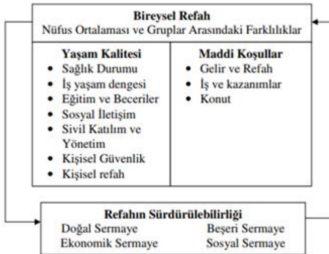
Tablo 2: OECD Daha İyi Yaşam Endeksi Kavramsal Çerçevesi